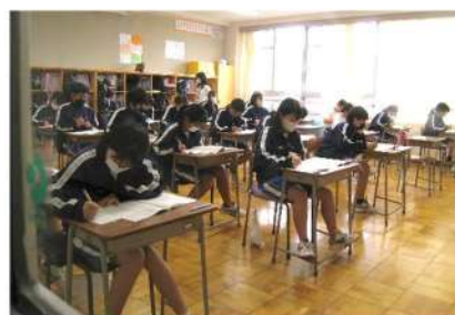
真剣に取り組んでいる3年生

また、4時間目には、学習意欲や学習方法・生活面等についても生徒質問紙調査として回答しました。この調査により測定できるのは学力の特定の一部であり、学校における教育活動の一側面ではありますが、夏休み中には集計結果とともに個人票が届けられます。その結果を分析したり、北相中学校区3校で情報交換をしたりしながら、学習指導の充実や改善に役立てていく予定です。