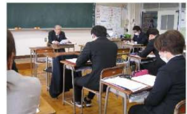
授業力向上を目指して！