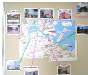
廊下に掲示された地図

6月1日（木）2年生が横浜への校外学習を実施しました。ここ数年、2学年では、「地域を知る・地域から学ぶ」ことをテーマに、小原本陣の見学や相模湖・ダムフィールドワークを行っていましたが、今年度は