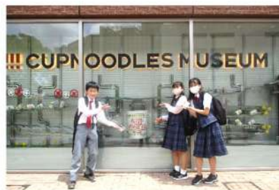
安藤百福発明記念館