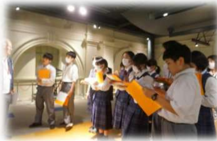
ガイドさんのお話真剣に耳を傾けました。