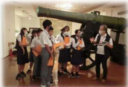
神奈川県立歴史博物館