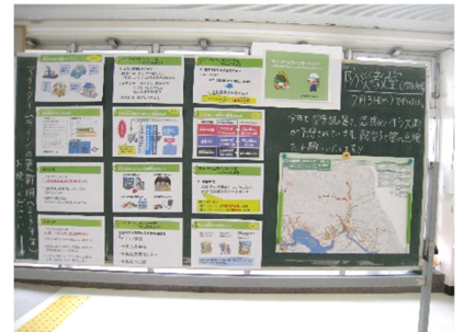
学習内容を三者面談に合わせて玄関ホールに掲示をしました。見ていただけましたか。

最後になりましたが、保護者の皆様、地域の皆様のご理解とご協力により、無事に1学期の終業式を迎えることができました。ありがとうございました。